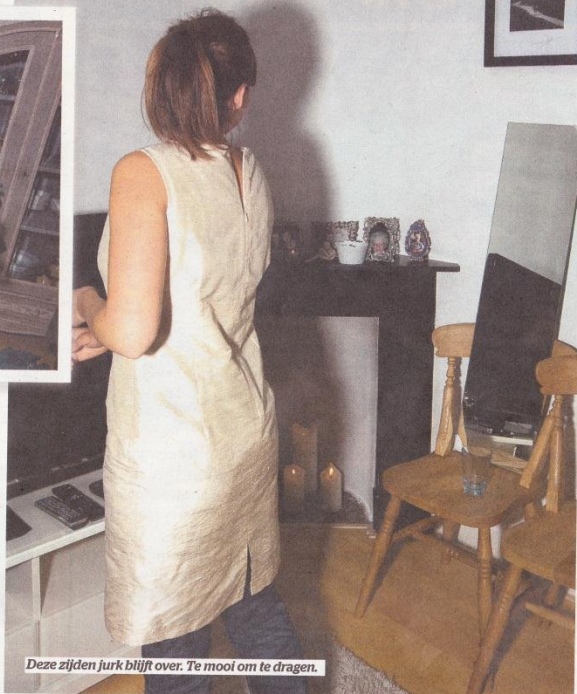
Deze zijden jurk blijft over. Te mooi om te dragen.