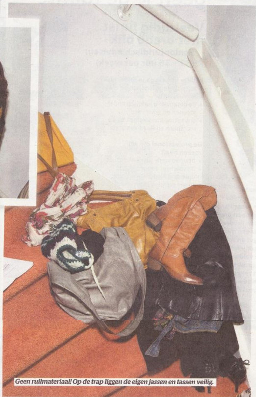
Geen ruilmateriaal! Op de trap liggen de eigen jassen en tassen veilig.