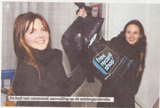
De buit van vanavond; aanvulling op de wintergarderobe.