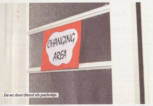
De wc doet dienst als pashokje.

India heeft haar oog laten vallen op een zwart jasje. 'Soms ben je je eigen kleren zat. Dan wil je wel winkelen, maar dat is duur. Dit is een prettige, goedkope manier om iets nieuws te vinden.'