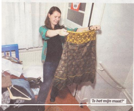
'Is het mijn maat?'