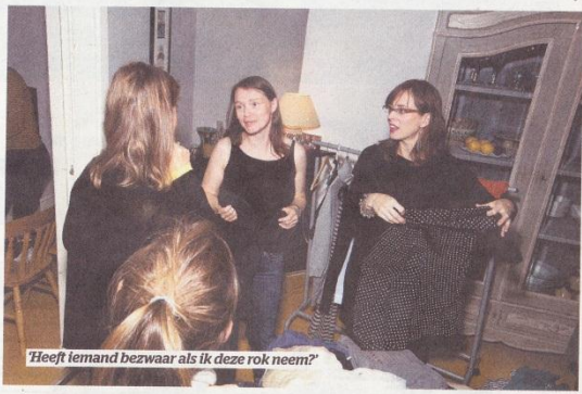
'Heeft iemand bezwaar als ik deze rok neem?'